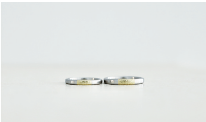
Pt & LG 地金コンビ + ストーン