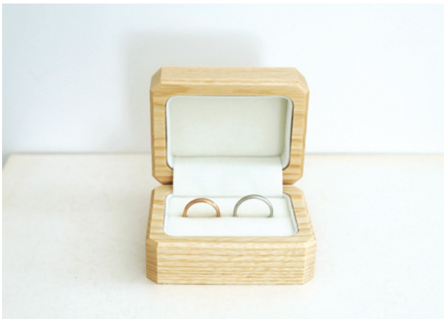
2.木のリングケース