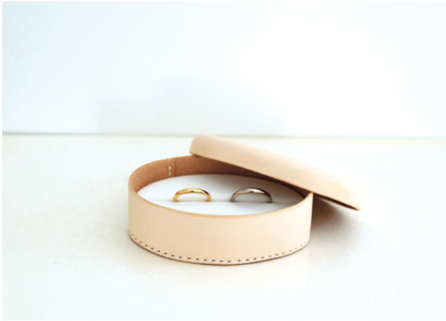
1.ヌメ革のリングケース

atelier tamariオリジナルのマリッジリングケースは オーダーの方にどちらか好きな方をプレゼントです。 日常の中に、指輪のベッドとしてお使いいただけるようなデザインです。